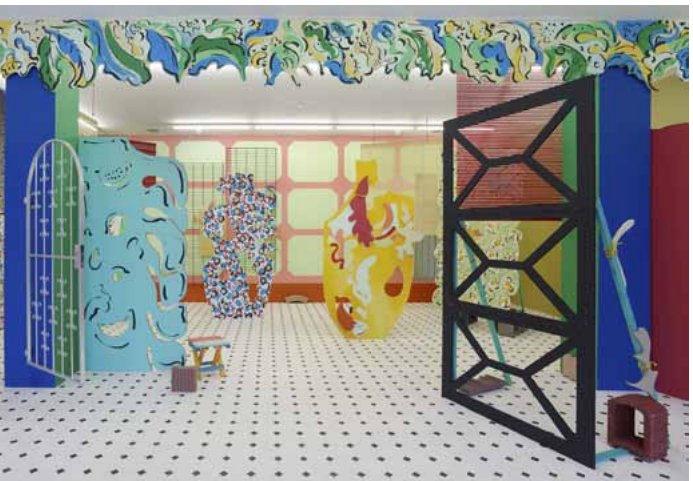
5 Interiores , 2017, Installationsansicht Dortmunder Kunst- verein, Courtesy of the artist und Laura Bartlett Gallery, London, Foto: Simon Vogel